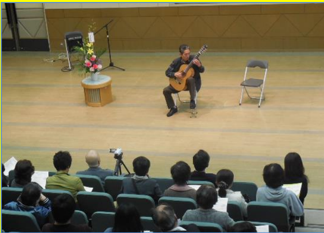
▲クラシックギターの美しい音色

4月9日（土）14時から、市民活動センター5階の交流ホールで山陰アマチュアギターネットワーク主催によるクラシックギターコンサートが開催されました。毎年4月に開催される恒例のコンサートも、今回で15回目です。当日は、松江市の最高気温が23.9度となる温かい日でしたが、会場に響き渡るクラシックギターの温かい音色は、気温と同様に温かく心地いい音色で、多くの観客を魅了しました。