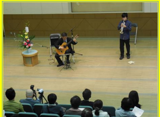
▲クラシックギターとトランペットの共演